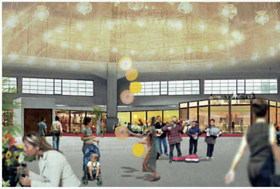
Markthalle von aussen und von innen