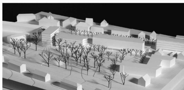
Verdichtung zu einem Ensemble entlang der Zürcherstrasse (3. Rang, Stutz + Bolt + Partner)

Info-Management Truninger Plot Scan Druck