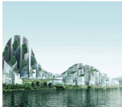
«Magic Mountains», geplant in Chongqing als dänisch-chinesische Kooperation (Bild: COBE and Chongqing University)

20. Jahrhunderts dokumentieren, ein Ausweichmanöver erkennen. Doch zum einen haben sich die Niederländer in den vergangenen Ausgaben der Biennale immer wieder mit aktuellen Problemen der Stadtplanung befasst, ohne sich auf Star-Architekturen zu kaprizieren. Zum andern ist ihnen eine «antizyklische» Schau gelungen, eine Präsentation in Plänen und Zeichnungen, die musealen Status beanspruchen dürfen und dokumentieren, wie die Niederländer (von H.P. Berlage über C. van Eesteren und J.B. Bakema, J.J.P. Oud bis Rem Koolhaas, UNStudio und MVRDV) ihre Stadt nicht