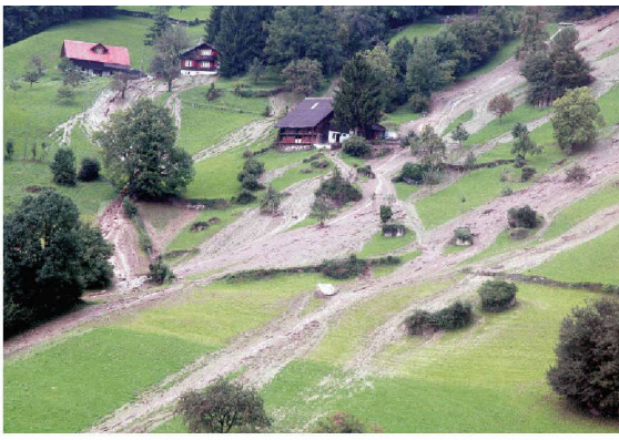
Hangmuren oberhalb von Weggis, aufgenommen aus der Gondel der Luftseilbahn Weggis–Rigi Kaltbad