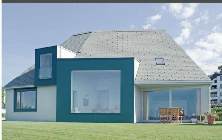
Pool Architekten, Zürich

Eternit Dachschiefer bietet nahezu unbegrenzte Möglichkeiten dazu.