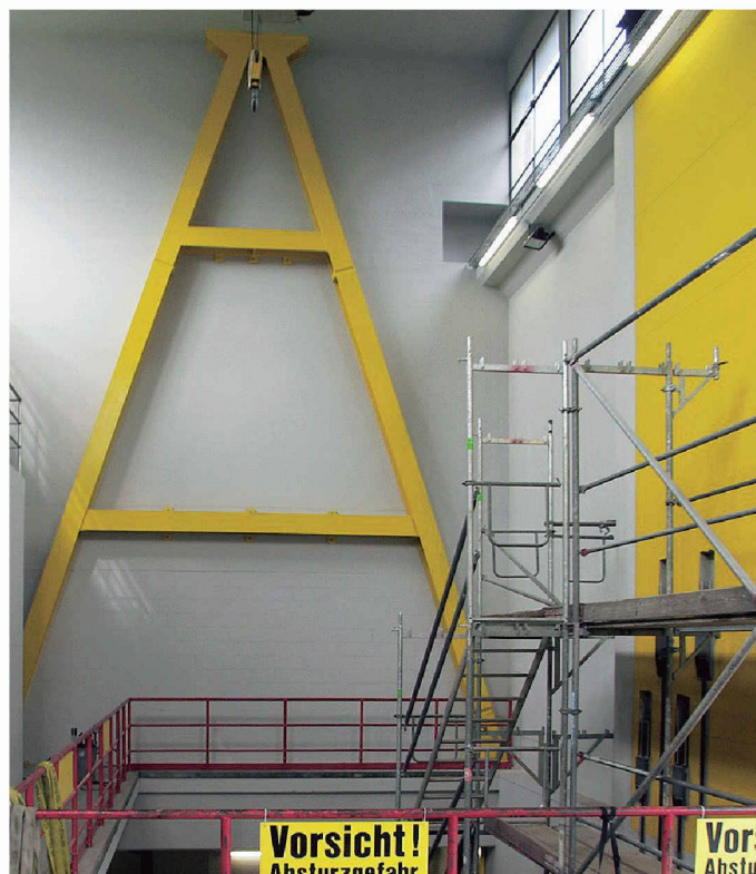
Erdbebenertüchtigung in einem Unterwerk mit Stahlfachwerk (hinten, gelb) und mit Stahlbetontragwand (rechts, gelb)

An der Konferenz kam der grosse Fortschritt zum Ausdruck, der in der letzten Zeit dank intensiver Forschung beim Wissen zum erdbebensicheren Bauen gemacht wurde. Prominente Referenten betonten die überragende Bedeutung eines adäquaten konzeptionellen