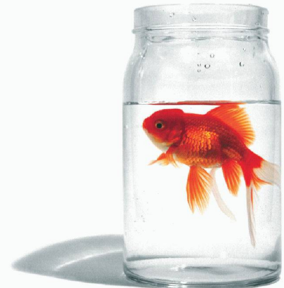
Optimal geschützt?