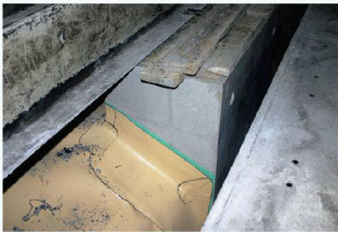
Versetzter Gewölbedrainageschacht mit verschweisster Tunnelabdichtungsfolie

Weitere Informationen: MÜLLER-STEINAG BAUSTOFF AG 6221 Rickenbach LU Tel. 0848 200 210 www.ms-baustoff.ch info@ms-baustoff.ch