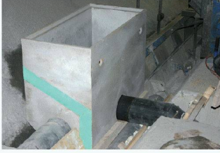
Versetzter Gewölbedrainageschacht mit integriertem MP-kaschiertem Blech