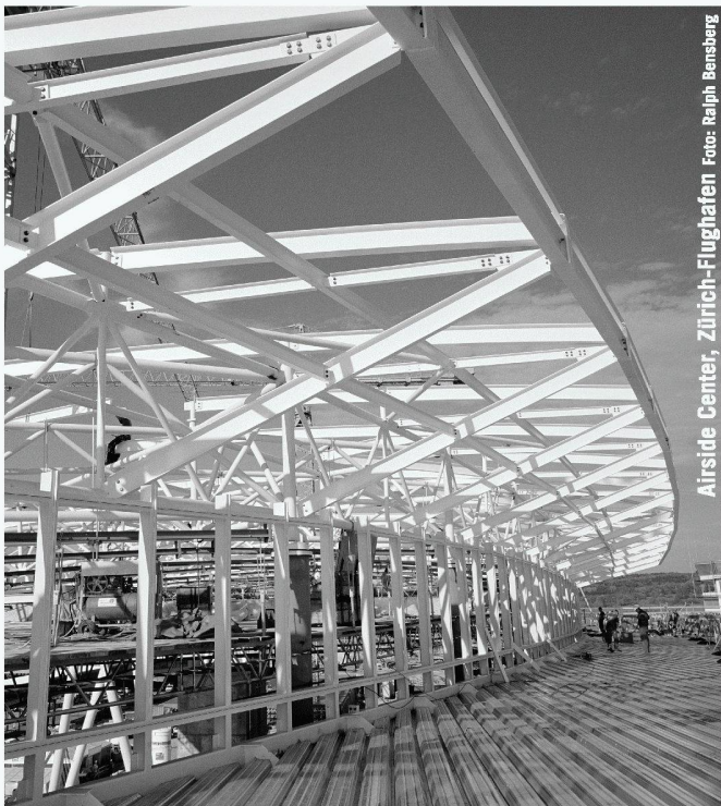
Airside Center, Zürich-Flughafen

Das Vorgehen auf der Baustelle war wie folgt: Verlegen und Einbetonieren der Sickerleitung und der Ableitung – Versetzen des Schachtes auf ein Mörtelbett in die Aussparung des Gewölbesockels (Kicker) – Verschweissen der Tunnelabdichtungsfolie mit dem MP-kaschierten Blech – Umbetonieren des Schachtes. Bereits wurden mit diesem System ca. 350 Schächte zur Zufriedenheit aller am Bau Beteiligten versetzt. Mit dieser Innovation kann die AGN einen dichten Schachtanschluss bei gleichzeitiger Zeit- und Kostenersparnis garantieren.