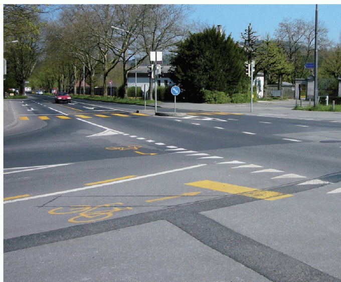
04 Markierter Haltepunkt für indirektes Linksabbiegen mit Zwischenhalt am rechten Rand

Linksabbiegen bestimmt. Genügend breite Fahrspuren (Überholen durch Personen- und Lastwagen möglich) und tiefe oder überfahrbare Randabschlüsse erhöhen die subjektive und die effektive Sicherheit. Auf Engpässe ohne Überholmöglichkeit muss ein rund 120–150 m langer Abschnitt folgen, der es dem nachfolgenden Verkehr ermöglicht, die Velos zu überholen. Breite, ausgeräumte Strassenräume verleiten die Fahrzeuglenker zu schnellem Fahren. Hier gilt es, die Anliegen des Veloverkehrs bei der Querschnittsbemessung zu berücksichtigen und im Interesse der Verkehrssicherheit so zu wählen, dass den Fahrzeuglenkern eine korrekte Einschätzung möglich ist, ob sie das Velo in genügendem Abstand überholen können.