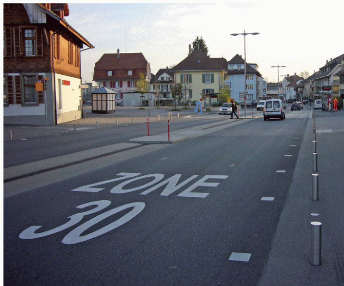
06 Die Durchfahrtsbreite von 4.20m ermöglicht bei Tempo 30 ein sicheres Überholen von Velo Fahrenden, auch wenn kein Radstreifen vorhanden ist

hohe städtebauliche Kriterien, zum Beispiel das Aufwerten von Aussenräumen, das Erhalten von Strassenzügen, das Schaffen von Freiräumen und Begrünung, erfüllen. Die Planung und die Umsetzung von Verbesserungen für den Veloverkehr sind deshalb anspruchsvolle Aufgaben. Die frühzeitige Koordination ist Voraussetzung, dass den verschiedenen, teilweise gegenläufigen Interessen Rechnung getragen werden kann. Damit lassen sich Einsparungen wie auch schwierige, oft nicht mehr mögliche Nachbesserungen vermeiden. Hilfreich ist ein klar definiertes Verfahren, um Differenzen zu bereinigen, nötigenfalls ist eine Interessensabwägung vorzunehmen. Die Handlungsfelder im Veloverkehrsnetz sind periodisch zu erheben und daraus Schwachstellen und Lücken abzuleiten. Der ausgewiesene Handlungsbedarf aus Sicht des Veloverkehrs soll in Kombination mit Grundsätzen zur Umsetzung in einem behördenverbindlichen Richtplan festgehalten werden.