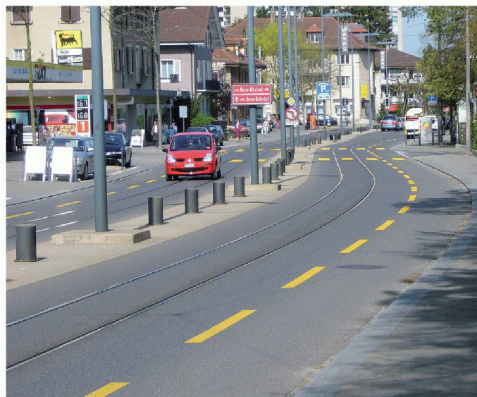
01 Der Abstand von einer Engstelle (z.B. Fussgängerschutzinsel) zur nächsten muss gross genug sein, um das Überholen von Velos durch einen LKW zu ermöglichen