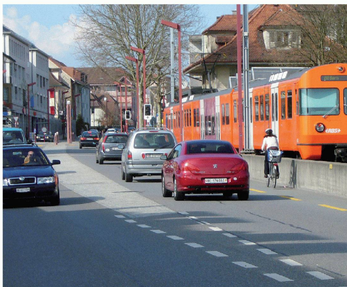
03 Ortsdurchfahrt mit einseitigem Radstreifen in der Steigung (Velokriechspur) und überfahrbarem Mehrzweckstreifen in der Mitte (Überholen Zweiräder, Linksabbiegen)