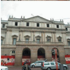
Neubauten in und an bestehenden Bauten

Durch die über 40-jährige Erfahrung und Spezialisierung auf vorbeugende und sanierende Abdichtung gegen drückendes Wasser, sowie ständige Weiterentwicklung der Produkte und Lösungen, können Sie mit RASCOR nur gewinnen.