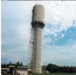
Behälter- und Bäderbau