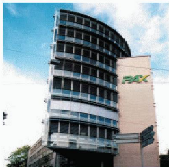
Gewerbe- und Wohnbau