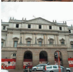
Neubauten in und an bestehenden Bauten

Durch die über 40-jährige Erfahrung und Spezialisierung auf vorbeugende und sanierende Abdichtung gegen drückendes Wasser, sowie ständige Weiterentwicklung der Produkte und Lösungen, können Sie mit RASCOR nur gewinnen.