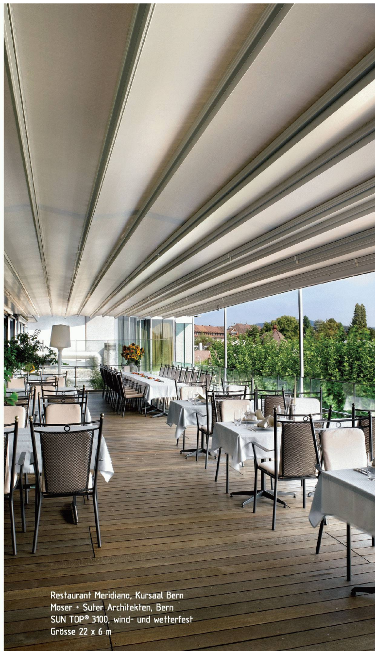
Restaurant Meridiano, Kursaal Bern Moser + Suter Architekten, Bern SUN TOP® 3100, wind- und wetterfest Grösse 22 x 6 m

Tiefbauamt des Kantons St.Gallen, Mai 2007