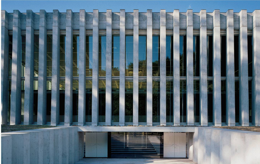
Livio Vacchini's Mehrzweckhalle in Losone