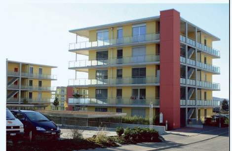
Aktuelles Beispiel effizienter Elementbauweise als gestalterisches Element am Bau

stärke von min. 10 cm erforderlich, bei höheren Türen und grösseren Querschnitten sowie im Aussenbereich empfehlen wir min. 12 cm Wandstärke.