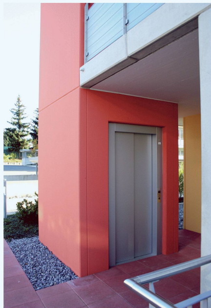
Fertiger Aussen-Liftschacht. Die feine Oberfläche des Betons kann leicht überstrichen werden.

Liftschächte nach Mass, im Elementwerk hergestellt, reduzieren die Bauzeit und die Kosten bei Neubauten wie auch bei Umbauten und Renovationen. Knapper Platz und komplizierte Zugänglichkeit verhindern oft das Schalen und Betonieren des Liftschachts vor Ort. Hier bietet sich die Elementbauweise geradezu an.