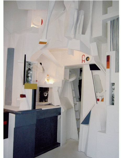
Ebenfalls «abseits»: Nachbildung von Schwitters' Merz-Bau. Das Museum Boijmans Van Beuningen – ein Steinwurf vom Nai entfernt – widmet dem Künstler Kurt Schwitters eine hervorragende Retrospektive

Für das Hafengebiet von Heijplaat wurde im vergangenen Jahr ein Wettbewerb ausgeschrieben. Von 398 Eingaben werden für die FollyDOCK EXPO nun deren 20 realisiert.