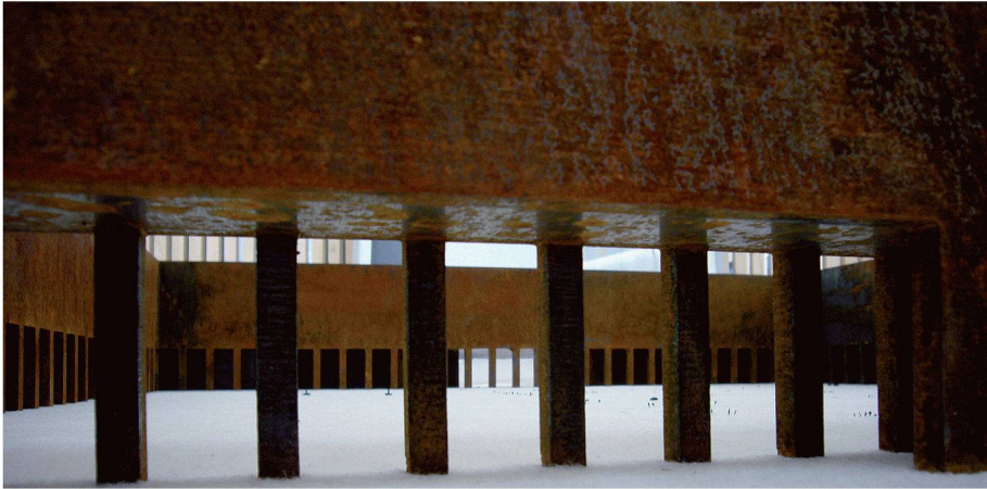
«Vision» für Ceuta: «Cité de Refuge», Nahaufnahme des Modells

Vor vier Jahren war die Biennale Rotterdam erstmals angetreten, die Architektur-Biennale in Venedig das Fürchten zu lehren. Die diesjährige Ausgabe ist nurmehr der Schatten der venezianischen Ausgabe von 2006.