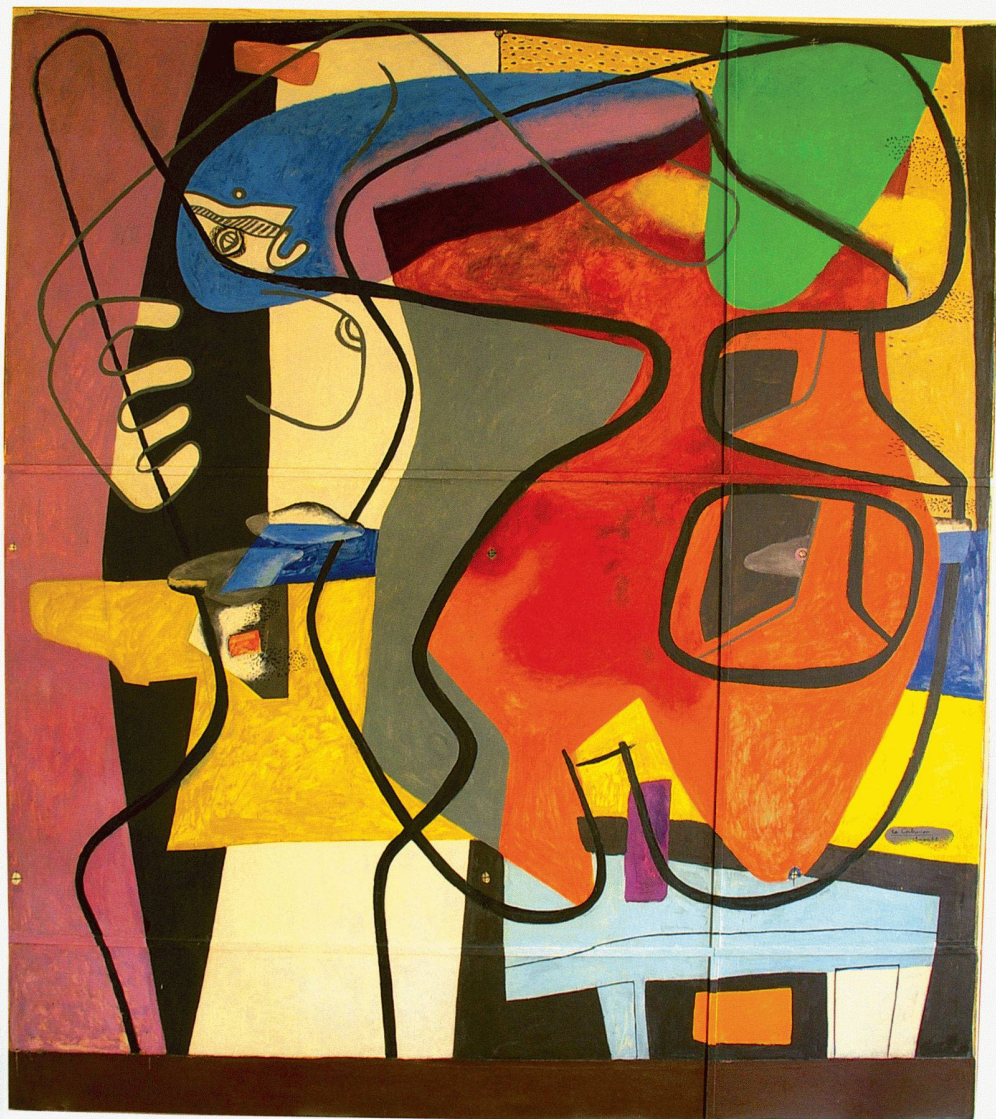
«Femme et coquillage IV», 1948: Das Wandgemälde, bestehend aus sechs Paneelen, das Le Corbusier 1948 im Büro an der Rue de Sèvres über Nacht gemalt hatte, galt bis vor zwei Jahren als verschollen

Wenn sich gegenwärtig eine architektonische Pilgerreise nach Rotterdam lohnt, dann wegen der Ausstellung «Le Corbusier – The Art of Architecture» im Niederländischen Architekturinstitut (Nai). Die Schau ist ästhetisch eine Augenweide, intellektuell eine Entdeckungsreise.