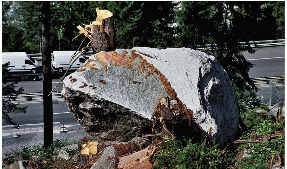
Ein intakter Schutzwald verkürzt die Anhaltstrecke von grossen Blöcken auf ein Viertel

Fachleute des Kantons Uri und der Eidgenössischen Forschungsanstalt für Wald, Schnee und Landschaft (WSL) nutzten das Ereignis, um das Wissen über das Verhalten herabstürzender Felsbrocken zu verbessern. Von Interesse sind insbesondere Geschwindigkeit, Sturzbahn und Energie der Felsbrocken sowie die abbremsende Wirkung des Schutzwaldes. Da ein beträchtlicher Teil des Schutzwaldes jedoch stark beschädigt wurde, war es nicht möglich, die kompletten Sturzbahnen im Gelände zu verifizieren. Anhand der Spuren im Gelände, insbesondere an Bäumen, konnten jedoch einzelne Sprünge rekonstruiert und so für zehn Blöcke die Energien berechnet werden. Im Bereich der Autobahn hatten die 20–50 m 3 grossen Blöcke Energien von 10 000–30 000 kJ. An den Stellen, wo jetzt die Schutzdämme gebaut wurden, ergab sich Sprunghöhen von 3–4 m und Sprungweiten von 20–25 m. «Da es sich bei den untersuchten Blöcken um diejenigen handelt, die am weitesten nach unten gestürzt waren, verwendeten wir diese Daten für die Berechnung der Schutzbauten», sagt Urs Thali, der vom Kanton Uri mit der Ausarbeitung des Projektes beauftragt wurde. In