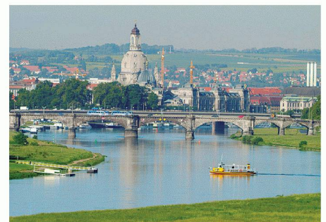
Diesen Blick vom Waldschlösschenpavillon auf die Innenstadt wird die neue Brücke verstellen

Kritik: www.welterbe-erhalten.de Brückenprojekt: www.eskr.de/Projekte