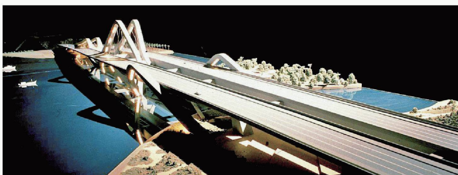
Die Gesamtlänge der Brücke beträgt 842.355 m, die Höhe 5.50 m, und sie weist mit beiden Fahrbahnen eine gesamte Breite von zweimal 23.7 m auf

Montage der Stahlbögen. Ende Mai 2007 wird der erste Stahlbogen (Spannweite 70 m, Gewicht 2000 t) geliefert und Ende Oktober 2007 der zweite (Spannweite 85 m, Gewicht 3000 t). Die Eröffnung der Brücke soll im Frühsommer 2009 stattfinden.