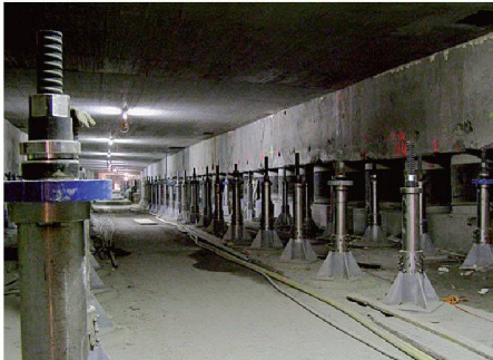
Chienbergtunnel, Kt. Basel-Landschaft

Am 21. Juni 2007 fand in Luzern der alljährlich durchgeführte Swiss Tunnel Congress statt. Das von der Fachgruppe Untertagebau des SIA zusammengestellte Programm zeigte das breite Spektrum des Tunnelbaus. Am 22. Juni hatten die rund 750 Besucher die Möglichkeit, an Baustellenexkursionen teilzunehmen.