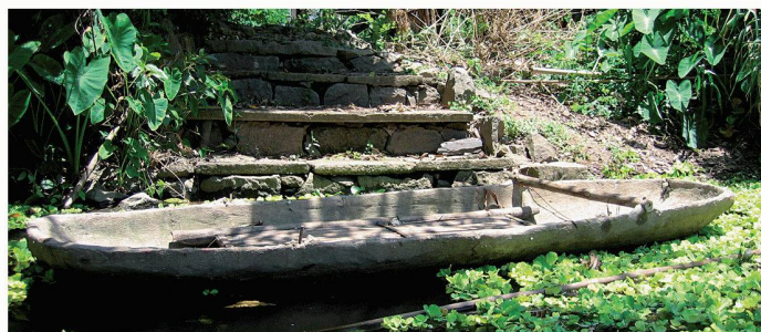
Betonkanus, hier auf einem Kanal bei Ninh Binh südlich von Hanoi, sind das alltägliche Gefährt vietnamesischer Reisbauern