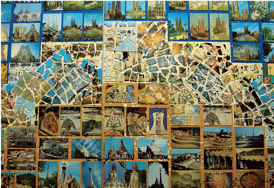
Postkartencollage mit Symbolkraft: Die Städtebauliche Zukunft Barcelonas verspricht weniger Harmonie, als dieses zwischen den Ausstellungen im Forum vermittelnde Kunstwerk erzielt

Recht unbelebt und auch nicht mehr ganz so blau wie bei seiner Eröffnung 2004 präsentiert sich heute Herzog & de Meurons «Forum» in Barcelona (siehe H. 19/2004). Der spektakuläre, dreieckige Solitär zwischen Mittelmeer und Südostende der berühmten Avinguda Diagonal hat unter Staub, Salz und Wind gelitten – und in den Ecken, die er nun einmal bildet, fängt sich neben unvermieteten Restaurantflächen gelegentlich der Plastikmüll.