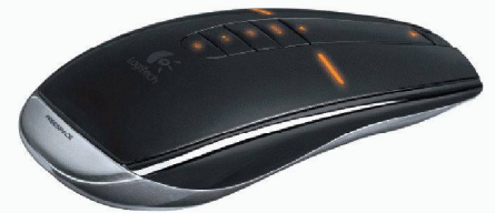
Logitech GmbH | 82110 Germering www.logitech-partner.com

Die wiederaufladbare MX-Air-Maus arbeitet mit der Logitech-2,4-GHz-Technologie mit einer Reichweite von 10 m. Anstelle eines traditionellen Tastenrads ist die MX-Air-Maus mit einem berührungsempfindlichen Scroll-Feld ausgestattet. Ein Strich mit dem Finger über die Oberfläche aktiviert den Scroll-Mechanismus, der die Geschwindigkeit an die Fingerbewegung anpasst.