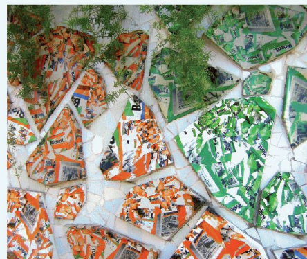
03 Moderne Mosaik à la Gaudí mit Zeitungstext verzieren die schwebenden Blumentöpfe

„ Wir sind in Nürnberg dabei, weil wir auf der Chillventa mit unserer MSR-Technik eine wichtige Rolle spielen. “