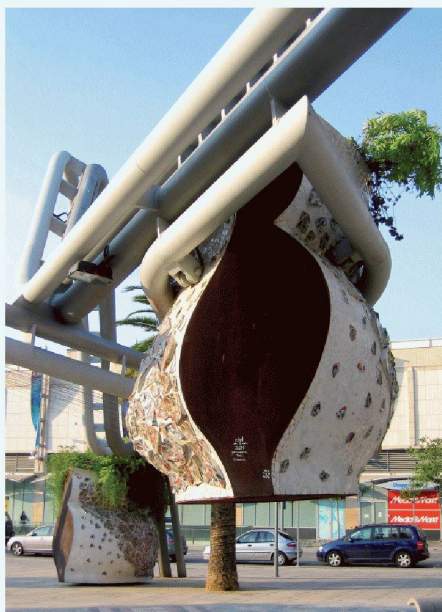
02 Wo Bäume fehlen, da spenden überdimensionale Blumentöpfe Schatten und erinnern an die Gärten von Privathäusern