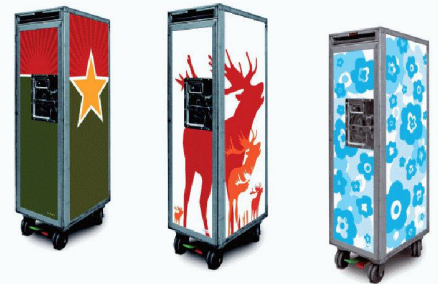
bordbar | D-50933 Köln www.bordbar.de

sen aufbewahrte, kann für Kleinigkeiten wie Schlüssel, Telefon oder im Büro für Briefumschläge verwendet werden. Zum Öffnen der Tür wird der Hebel nach oben geschoben (open – close). Sie lässt sich um 270° drehen und liegt somit an der Aussenseite an. Ein Magnet sichert die Tür. Im Inneren befinden sich 27 Führungen für Schubkästen und Regalböden. Sie garantieren eine flexible Inneneinteilung. Für den sicheren Stand sorgt eine Fussbremse. «Bordbar» bietet eine Vielzahl an Mustern an. Diese werden als digital bedruckte Folie aufgetragen und können auf der Website ausgewählt werden.