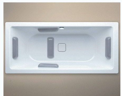
Franz Kaldewei GmbH & Co. KG | D-59206 Ahlen www.kaldewei.com

Ein zweiter Entwurf von Phoenix Design ist das Ornament «Lilie» für Duschwannen. Die zarten Blütenornamente in Grautönen harmonisieren mit den aktuellen Trends in der Bodengestaltung. Ob kombiniert mit Holz- oder Steinboden, Natursteinen oder schlichten Fliesen – das dezente Muster zaubert einen Hauch von Exotik in moderne Badezimmer. Für zuverlässige Haltbarkeit und Beständigkeit werden die Ornamente in einem speziellen Emailverfahren dauerhaft in die Oberfläche eingebrannt, so dass die floralen Muster eine feste, untrennbare Verbindung mit der Duschfläche eingehen.