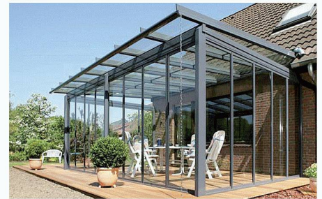
Solarlux (Schweiz) AG | 4415 Lausen www.solarlux.ch

terialauswahl ganz auf Langlebigkeit und hohe Stabilität ausgelegt. Dabei werden Aluminiumprofile mit Stahlarmierungen in den Sparren, Traufen und Stützen verstärkt oder statt verwindungsanfälligen Massivholzes Leimbinder aus Furnierschichtholz mit hoher Formstabilität verwendet. So können auch deutlich grössere Spannweiten realisiert werden.