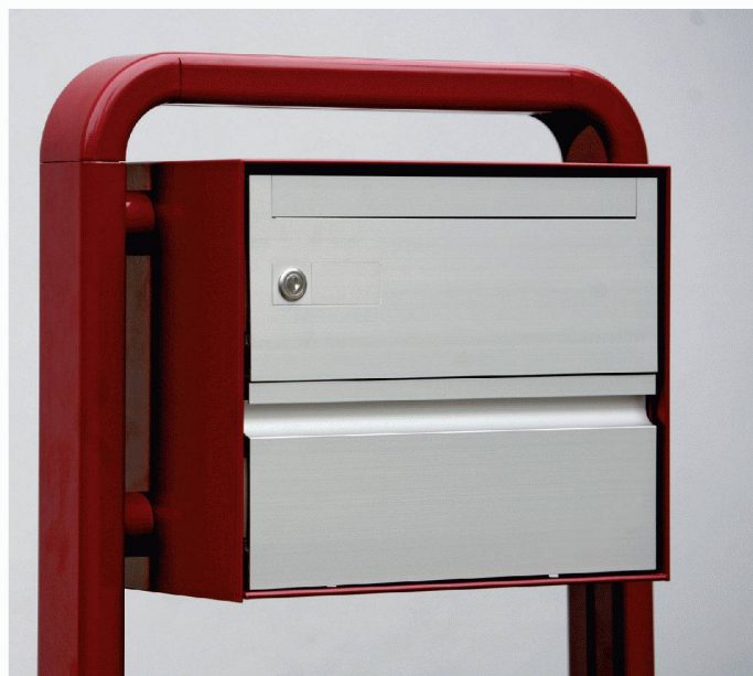
Typ deluxe B - Einzel - Jochstütze

Als Spezialist für Briefkästen möchten wir Ihre Ideen und unsere Erfahrungen verbinden, um eine Lösung mit hohem Nutzwert in Funktion, Design und Preis zu erreichen.