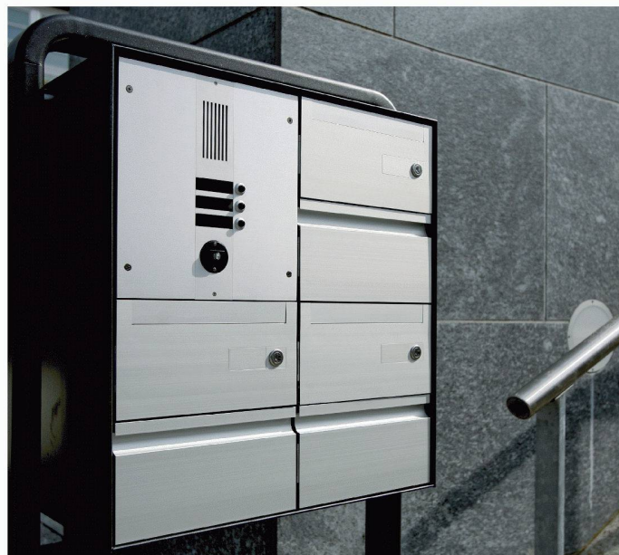
Typ deluxe S - Gruppe - Jochstütze - Sonnerie