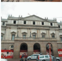
Neubauten in und an bestehenden Bauten

Durch die über 40-jährige Erfahrung und Spezialisierung auf vorbeugende und sanierende Abdichtung gegen drückendes Wasser, sowie ständige Weiterentwicklung der Produkte und Lösungen, können Sie mit RASCOR nur gewinnen.