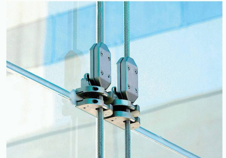
Du Pont de Nemours (Deutschland) GmbH D-61343 Bad Homburg | de.news.dupont.com

gen ist auch deren gute Haftung an Metall entscheidend für die Stabilität der Fassade. Dadurch lassen sich die Lasten hocheffizient auf die sehr klein ausgeführten Punkthalterungen aus Stahl übertragen. Aufgrund ihrer geringen Grösse bietet die Aussenhaut der Fassade ein nahezu durchgängiges Erscheinungsbild, das nicht durch Bohrungen oder Befestigungselemente gestört wird. Zudem sorgen die SentryGlas-Plus-Zwischenlagen für eine sehr hohe Resttragfähigkeit der Fassadenelemente nach einem Bruch des Glases. Der Wartungsaufwand ist gering.