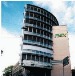
Gewerbe- und Wohnbau