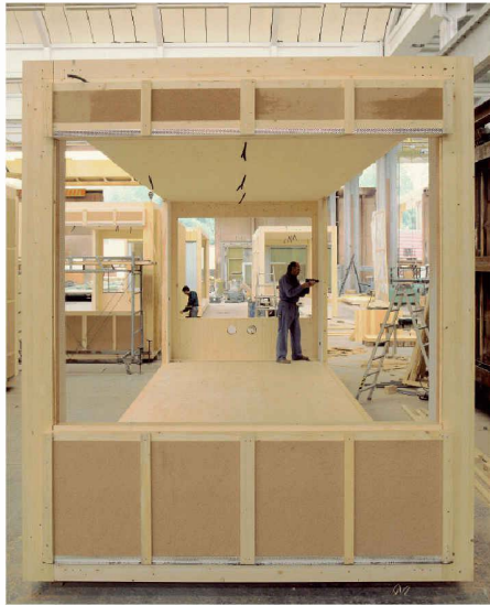
Praxisorientierte Forschung und Entwicklung haben im Holzbau zu einem hohen Stand der Vorfertigung geführt. Im Bild die Produktion von «Zürich-Modular», Schulbauten für 26 Standorte in der Stadt Zürich nach dem Konzept von Bauart Architekten, Bern

Auf nationaler Ebene sollen Forschung, Entwicklung und Innovation im Zusammenhang mit dem Werkstoff und Energiespender Holz koordiniert werden. Die zu diesem Zweck vor zwei Jahren aufgegleistete «Innovations-Roadmap 2020» (TEC21 Nr. 26/2006, S. 34) nimmt Formen an.