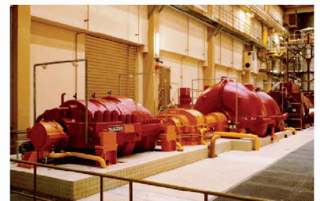
02 Der zweistufige Kompressor des Luftspeicher-Gasturbinen-Kraftwerks Huntorf. Im Hintergrund rechts schliessen Generator und Gasturbine an