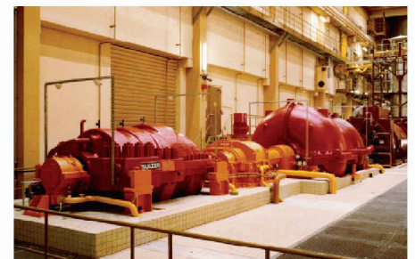
02 Der zweistufige Kompressor des Luftspeicher-Gasturbinen-Kraftwerks Huntorf. Im Hintergrund rechts schliessen Generator und Gasturbine an