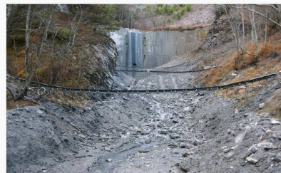
Die drei noch ungefüllten Murgang-Barrieren mit dem Staudamm im Hintergrund