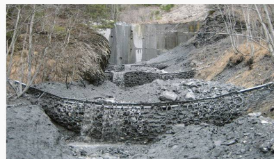
Die ausgebildeten Stufen der drei natürlich verfüllten Barrieren nach dem zweiten Murgang