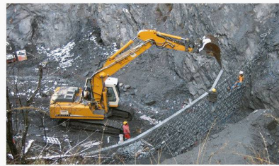
Montage der Barrieren mit leichter Bohrmaschine und Bagger

Weitere Infos erhalten Sie von Geobrugg Schutzsysteme, Romanshorn, E-Mail: info@geobrugg.com