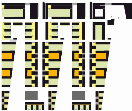
05 Messestadt München Riem Ost: Die Struktur aus Strassen, Plätzen, Zugangshöfen und ruhigen Grünräumen bietet ein differenziertes Angebot ineinandergreifender Räume für Alltagsnutzungen (Ammann Albers StadtWerke, Zürich)

halböffentlichen Höfen und grünen Ruheräumen geschaffen. Die Wohnungseingänge liegen an der Strasse oder in halböffentlichen Höfen. U-Bahn-Ausgänge, Läden und öffentliche Bauten sind strategisch positioniert, um den öffentlichen Raum zu aktivieren. Das Baurecht schliesst an Strassenkreuzungen im Erdgeschoss Wohnungen aus. Im Quartier entstehen nun Läden, Cafés und publikumsorientierte Büros. Wir glauben, dass wir damit eine Basis für ein lebendiges Quartier gelegt haben.