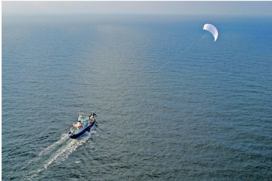
01 Testlauf mit dem Küstenschiff MS «Beaufort» im Jahr 2007: Der Zugdrachen steigt bis zu 300 m hoch und nutzt dort die beständigen höheren Windgeschwindigkeiten

Das Segelsystem der Hamburger Firma Skysails nutzt wie ein Kitesurfer einen Lenkdrachen als Schiffsantrieb. Dieser Hybridantrieb entdeckt den Wind als kostengünstigste Energiequelle auf hoher See für die moderne Frachtschifffahrt wieder.