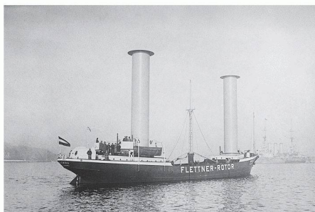
02 MS «Buckau» mit Flettnerrotoren, 1924

(af) Am 23. Januar 2008 brach die MS «Beluga SkySails» zu ihrer Jungfernfahrt von Bremerhaven nach Venezuela auf. Das Besondere an diesem Frachter ist ein 160 m 2 grosser vollautomatischer Lenkdrachen, der mit einer Zugkraft von 5 t den Schiffsmotor unterstützt. Abhängig von den Windverhältnissen sollen im Jahresdurchschnitt der Treibstoffverbrauch und die Kosten um 10 bis 35 % sinken, bei optimalen Windbedingungen zeitweise sogar um bis zu 50 %. Das System soll sich in drei bis fünf Jahren amortisieren.