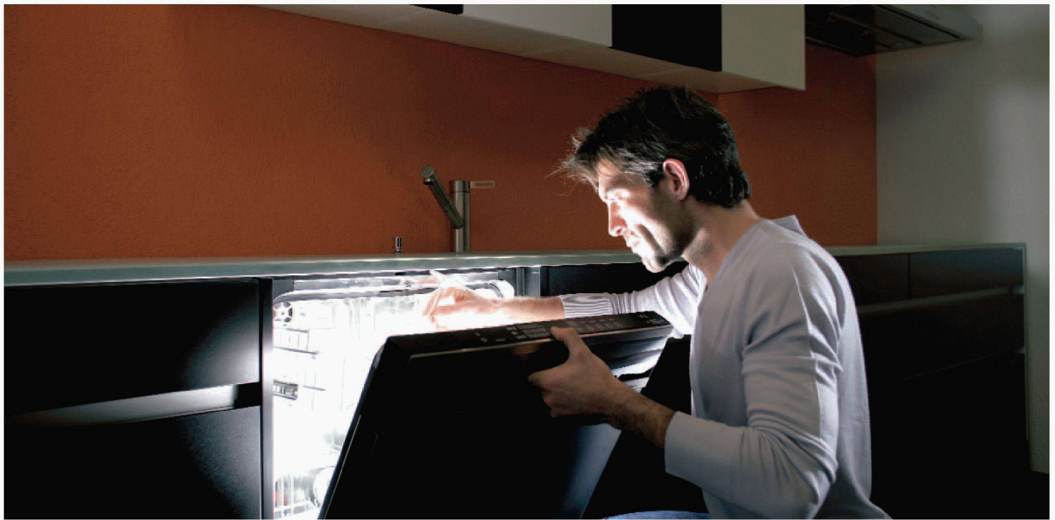
Einfach schön, wenn Teller und Gläser im richtigen Licht erscheinen: Die komfortablen Electrolux-Geschirrspüler machen es möglich.