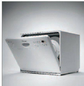
Die kompakte Lösung.