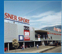
Media Markt, Conthey