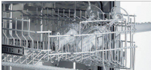
Komfortable Bedienung des Oberkorbs.