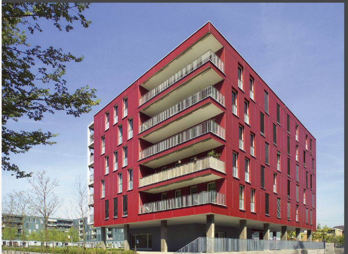
Architekten: Tina Arndt, Daniel Fleischmann, Zürich

Die Auseinandersetzung mit Funktion, Raum und Proportionen als kreativer Prozess. Die Wahl des Materials als entscheidendes Element einer konsequenten Umsetzung.