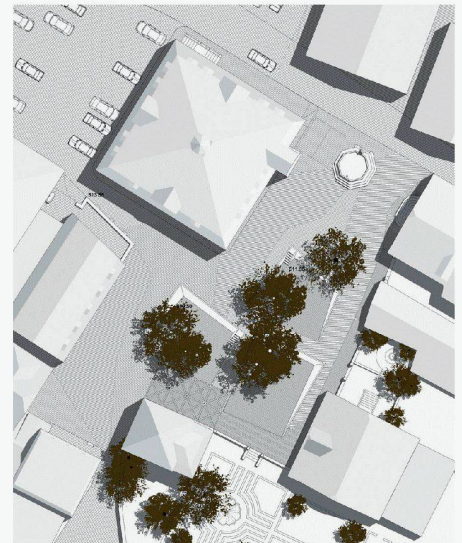
01+02 1. Preis (9000 Fr.): «SUIT», Beglinger + Bryan Landschaftsarchitektur, Mollis. Abgrabungen bilden von unten betrachtet kleine ebene Aufenthaltsbereiche, während sich die Metzghofstatt von oben betrachtet als grosszügiger Platz präsentiert