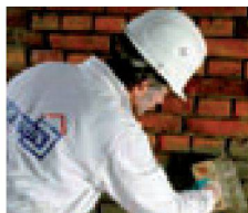
2. Aufbringen der Haftbrücke mit Remmers Sulfatexschlämme schnell während der Kiesel-Reaktionszeit.