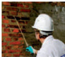
1. 09:30 Uhr: Grundierung des vorbereiteten Untergrundes mit Kiesel 1:1 mit Wasser. Stark saugende Untergründe sind vorzunässen.