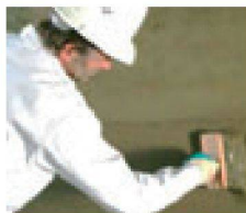
5. + 6. 10:00 Uhr: Im Schlämm- oder Spachtelverfahren wird die Remmers Sulfatexschlämme schnell je nach Lastfall in zwei oder drei Abdichtungsschichten frisch in frisch aufgebracht.