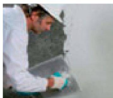
7. 13:00 Uhr: Ohne vorherigen Spritzbewurf kann als Oberflächenschutz der normal- oder schnellabbindende Remmers Sanierputz oder wahlweise auch die Remmers Schimmel-Sanierplatte aufgebracht werden.