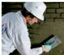
3. + 4. In die frische Haftbrücke wird der Remmers Dichtspachtel eingebracht. Egalisierung und Hohlkehle bis 50 mm Schichtdicke finden in einem Arbeitsgang statt.