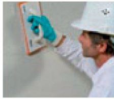
8. Der jeweilige Sanierputz wird mit dem Schwambrett abgerieben. Wenn die Oberfläche rapportiert werden soll ist eine Überarbeitung mit dem Remmers Feinputz notwendig.

Im Zuge mit der stetigen Raumerweiterung erschliessen wir tägliche Neben- und Kellerräume als Lebensräume. In diesem Zusammenhang stellen die Gegebenheiten hohe Anforderungen an die Planenden und die Verarbeiter, sowie an die Materialindustrie. Ein geschickter Einsatz der zur Verfügung stehenden Möglichkeiten garantiert so ein Gelingen seines Vorhabens.