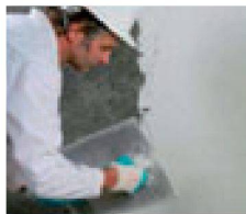
7. 13:00 Uhr: Ohne vorherigen Spritzbewurf kann als Oberflächenschutz der normal- oder schnellabbindende Remmers Sanierputz oder wahlweise auch die Remmers Schimmel-Sanierplatte aufgebracht werden.