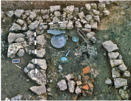
03 In einer Mauerecke verstecktes, wertvolles Bronzegeschirr, das Bewohnerinnen und Bewohner von Augusta Raurica in einer Notzeit im Boden ihres Hauses verborgen haben. Scharmützel der Alamannen von jenseits des Rheins machten damals den Stadtbewohnern das Leben schwer und unsicher. Dank der gut erhaltenen Originallage und dank einer minutiösen Grabungsdokumentation lassen sich solche Befunde interpretieren und rekonstruieren