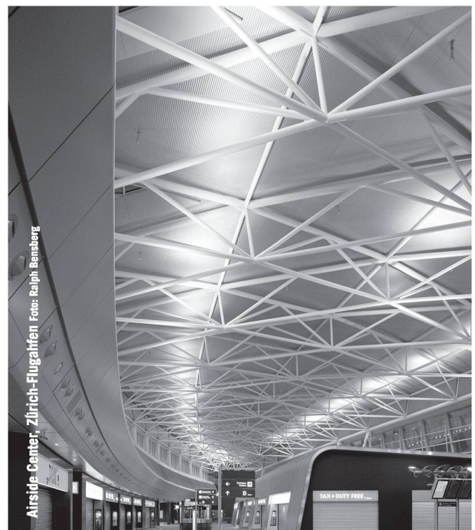
Airside Center, Zürich-Flughafen

Emil Keller AG Tiefbauunternehmung Inhaber André Oberhänsli Neumühlestrasse 42 Tel. 052 203 15 15 / Fax 052 202 00 91 8406 Winterthur / 8460 Marthalen www.emil-keller.ch