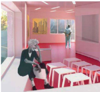
01 + 02 Innenraum und Grundriss des Siegerprojekts (Montage und Plan: A. Weber und S. Gallo)