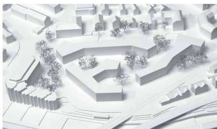
02 Grossformen mit differenzierten Bezügen