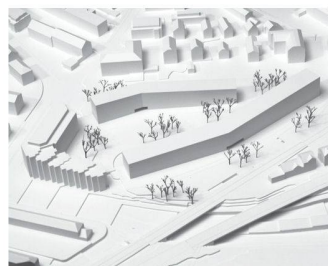
09 «Bolek & Lolek»