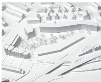
08 «Déjeuner sur l'herbe»