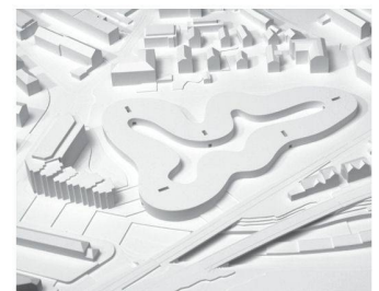
11 «Yellow Ribbon»