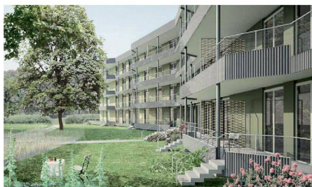
01–03 Siegerprojekt «Regina»