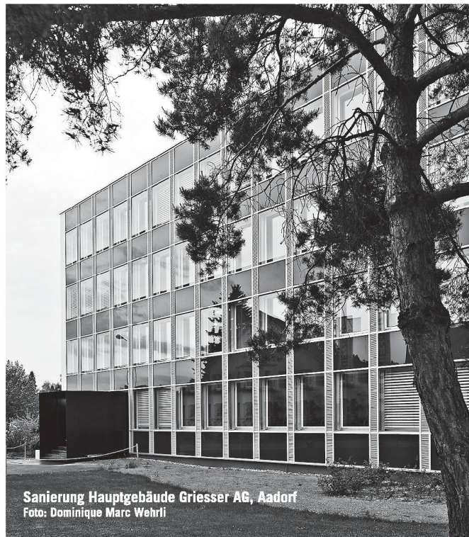
Sanierung Hauptgebäude Griesser AG, Aadorf

Biotech Energietechnik AG, Vertrieb Schweiz: Huggler Energietechnik ●● Nollenhornstrasse 7, 9434 Au/SG, 071 740 16 83, Fax 071 740 16 84, Büro Mittelland: H.P.Kummer, 3269 Arch, 079 340 90 57, office@biotech-energietechnik.ch , www.biotech-energietechnik.ch