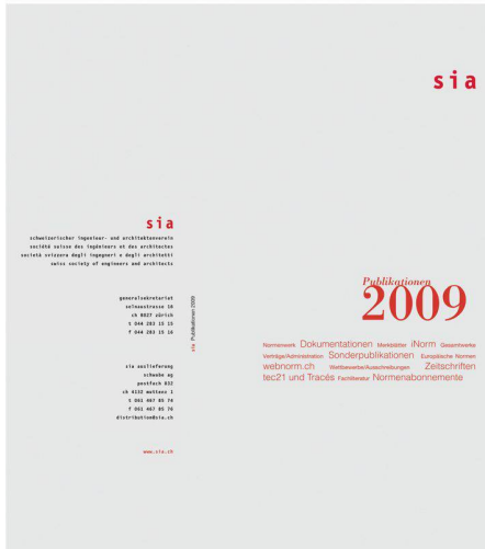
01 Das Publikationsverzeichnis mit neuem Umschlag (Gestaltung: sia)

(sia) Das SIA-Publikationsverzeichnis 2009 ist erschienen und glänzt in diesem Jahr mit einem neuen Umschlag. Das Verzeichnis listet auf 43 Seiten das gesamte Verlagsprogramm des SIA sowie weitere Fachbücher auf und ist auf Deutsch und auf Französisch erhältlich. Auf den ersten Seiten sind die Neuerscheinungen samt Titelblatt abgebildet und kurz beschrieben. Das gesamte lieferbare Normenwerk des SIA – Normen, Ordnungen und Merkblätter – ist in numerischer Reihenfolge aufgelistet, wobei für die thematische Suche ein Sachwortregister im Anhang zur Verfügung steht. Webnorm und i-Norm werden nochmals ausführlich vorgestellt: Unter www.webnorm.ch können sämtliche Verlagsprodukte des SIA ebenfalls bestellt werden. Ein einmaliger Download von Publi-