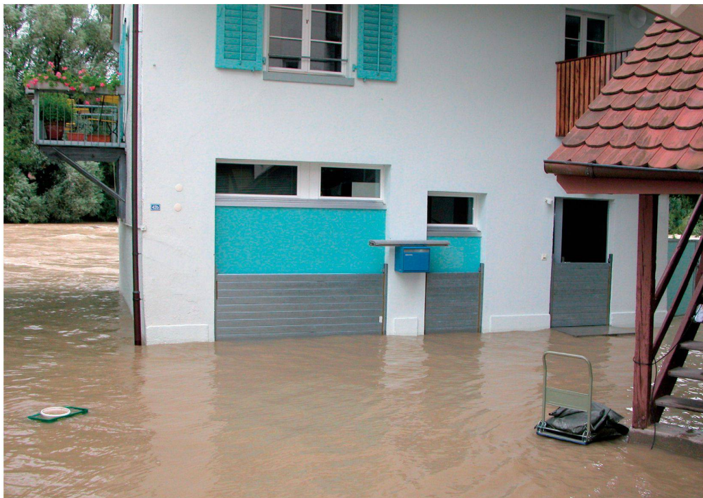
Die von der Reuss umspülte Liegenschaft Riegger in Mellingen (AG) blieb dank den mit dem WP WASTO-Hochwasserschutz-System abgeschotteten Türen und Toren vor grösseren Schäden bewahrt.

Debrunner Acifer, mit Standorten in der ganzen Schweiz, hat ein breites Sortiment im Bereich Gebäudeschutz. Produkte wie das Hochwasser- und Vandalismusschutz-System WP-Wasto, Brandschutztürsysteme der Firmen JANSEN oder FORSTER, Geokunststoffe für den Einsatz gegen gravitative Naturgefahren, Bewehrungstechnik-Produkte zur Erhöhung der Erdbebensicherheit im Bau und eine Vielzahl von Geräten und Ausrüstungsmittel für den Notfall-Einsatz stehen zur Verfügung.