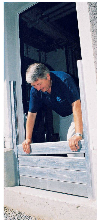
Montage der vorbereiteten Lamellen durch Metallbau Zimmermann, Matte Quartier, Bern.

Unscheinbare Rinnsale werden innert Stunden zu reissenden Wildbächen und vormals regulierte Wasserläufe nehmen sich unter dem Einfluss von starken Regenfällen einfach den Platz, den sie benötigen. Solche Bilder bekommen wir nun bereits seit einigen Jahren mit immer grösserer Regelmässigkeit zu sehen. Ein grosser Teil der entstandenen Gebäudeschäden ist durch das Eindringen von Wasser bei undichten Türen und Fenstern sowie durch den Rückstau im öffentlichen Mischwasserkanal entstanden.