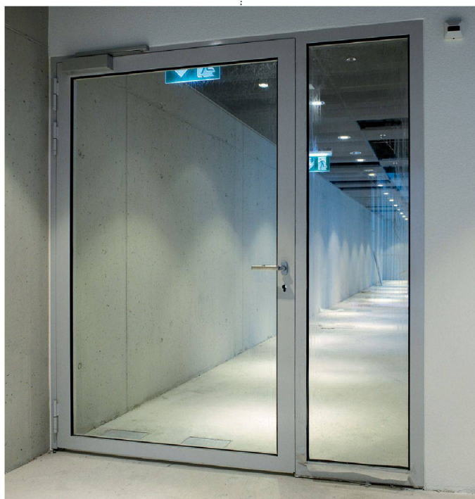
Brandschutztüre im neuen Dienstleistungszentrum Futuro in Liestal (BL)

und weitere Standorte überall in Ihrer Nähe www.d-a.ch