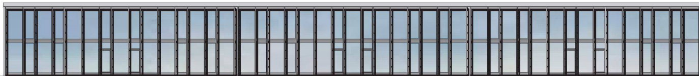
03 Wettbewerbsprojekt: neue Fassade des Klassentraktes (Bild: Jürg Graser)

möglichen Haltungen – entweder die bestehende Glasfassade nach denkmalpflegerischen Grundsätzen zu erhalten oder eine Neuinterpretation derselben vorzuschlagen. Mit der oben zitierten Aussage Fritz Hallers im Hinterkopf kam für uns von vornherein nur eine Neuauslegung in Frage. 2