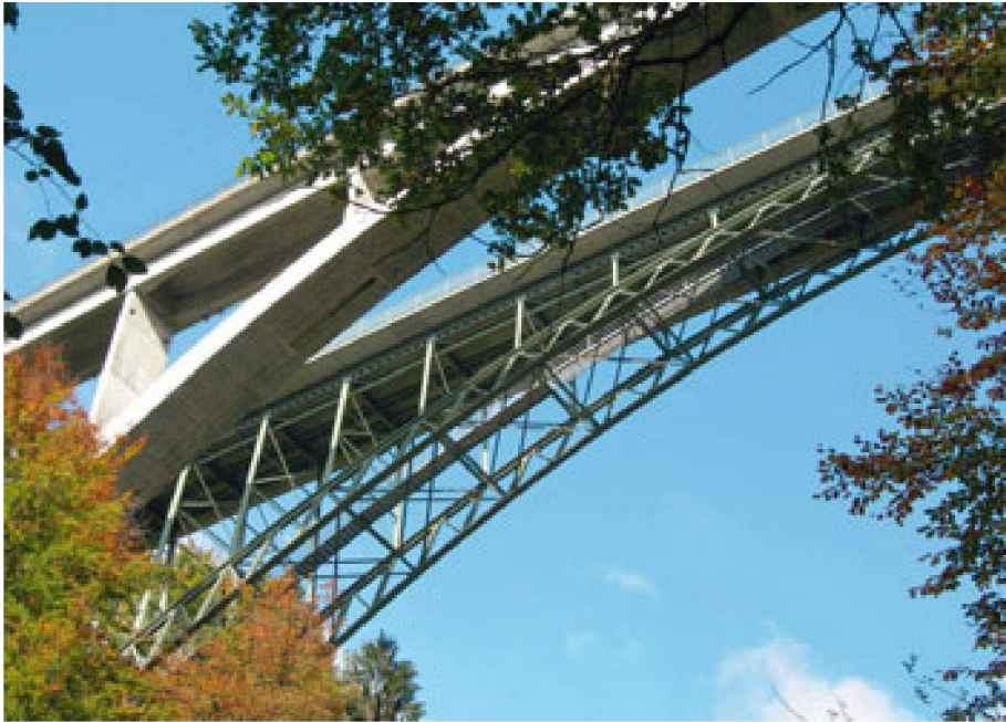
01 Schwarzwasserbrücken

Das zurzeit grösste Normenprojekt des SIA, die Normenfamilie SIA 269, steht vor seiner Bewährungsprobe: Mitte September beginnt die öffentliche Vernehmlassung aller acht Teilnormen. Läuft alles nach Plan, erfolgt die Publikation Mitte 2010.