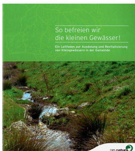
Pro Natura Basel-Landschaft (Hg.): So befreien wir die kleinen Gewässer. Pro Natura Basel-Landschaft, 2009. Ordner, 117 S., Fr. 80.–

(cc) Bei der Aufwertung von kleineren Fließgewässern besteht Nachholbedarf. Deren ökologisches Potenzial ist noch wenig bekannt, zudem liegt ihre Aufwertung vor allem im Aufgabenbereich der Gemeinden. Um die Fachleute in Verwaltungen und Planungsbüros bei der Ausdolung und Revitalisierung von Kleingewässern zu unterstützen, hat Pro Natura den Ordner «So befreien wir die kleinen Gewässer» herausgegeben. Er gliedert sich in drei Teile. Der Grundlagenteil informiert über Bedeutung und Potenzial der Kleingewässer, die gesetzlichen Grundlagen und mögliche Akteure, Interventionsmöglichkeiten und Instrumente. Allerdings beziehen sich diese Informationen v.a. auf die Verhältnisse im Kanton Basel-Landschaft. Für Fachleute aus anderen Kantonen dürften daher