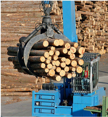
01 Baumstammtransport über den Lagerplatz der Grosssägerei der ehemaligen Stallinger Swiss Timber in Domat/Ems GR (inzwischen von der Mayr-Melnhof Holz Holding übernommen)

Das Forschungsprogramm «Waldnutzung» der WSL ist inzwischen abgeschlossen. Dies war der Anlass, um an einer Fachtagung in Birmensdorf über die Zukunft der Forst- und Holzwirtschaft unter den Vorzeichen globaler Entwicklungen nachzudenken.