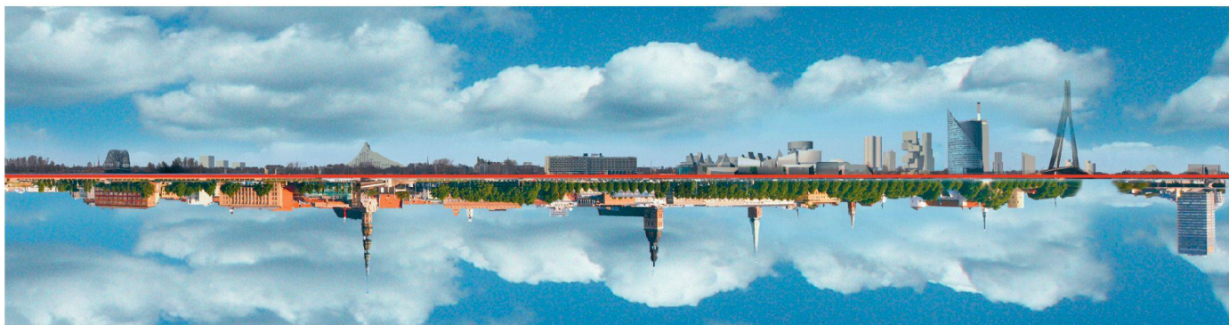
01 Riga: zwischen Welterbe und Moderne

Unesco-Welterbe seit 1997 und «künftige Weltstadt moderner Architektur»: Riga hat sich viel vorgenommen. Dass die lettische Hauptstadt aber nicht nur baulich über ein enormes Entwicklungspotenzial verfügt, stellte sie angesichts des diesjährigen Welttags der Architektur eindrücklich unter Beweis.