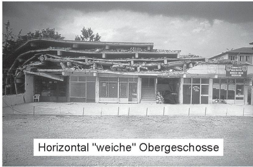
Horizontal "weiche" Obergeschosse