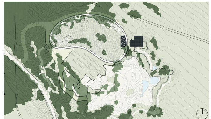
07+08 «Xishuangbanna»: Die enge Schlucht erlaubt Besuchenden nur Blicke von oben auf die Tiere, die «Tiermanagementqualität» hingegen ist sehr hoch