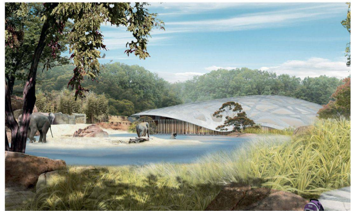
01+02 Siegerprojekt «Antoni»: kompakte Halle in einer szenografisch unaufgeregten Savannenanlage (alle Bilder: Verfassende)

Ein «Elefantennest» für Zürich? Das Tragwerk weckt sportliche Erinnerungen: Beim erstplatzierten Projekt «Antoni» im Wettbewerb für den Elefantentempel im Zürcher Zoo darf man jedoch gespannt sein auf die innovative Umsetzung in Holz.