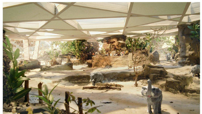
05+06 «elephant-gorge»: Das markante, grossflächige und erweiterbare Ortbetondach dominiert die Landschaft, Tiere und Besuchende