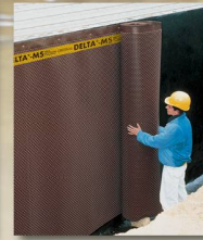
DELTA-MS Sauberkeitsschicht, Grundmauerschutz und Sickerschicht