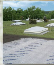
DELTA-TERRAXX Hochwertiges Schutz- und Drainagesystem

Wer optimale Flächendrainung und perfekten Grundmauerschutz anstrebt, kommt an den DELTA ® -Noppenbahnen aus dem Hause Dörken nicht vorbei. Für alle Objekte im Hoch-, Tief- und Ingenieurbau bieten sie eine hohe Sicherheit vor Feuchtigkeit. Von der Standard- bis zur innovativen High-Tech-Anwendung: Das DELTA ® -Noppenbahn-Programm ist so vielseitig wie Ihre Anforderungen. Die Dörken-Experten beraten Sie gern persönlich, welche Bahn für Ihr nächstes Projekt massgeschneidert ist. Vereinbaren Sie gleich einen Gesprächstermin!