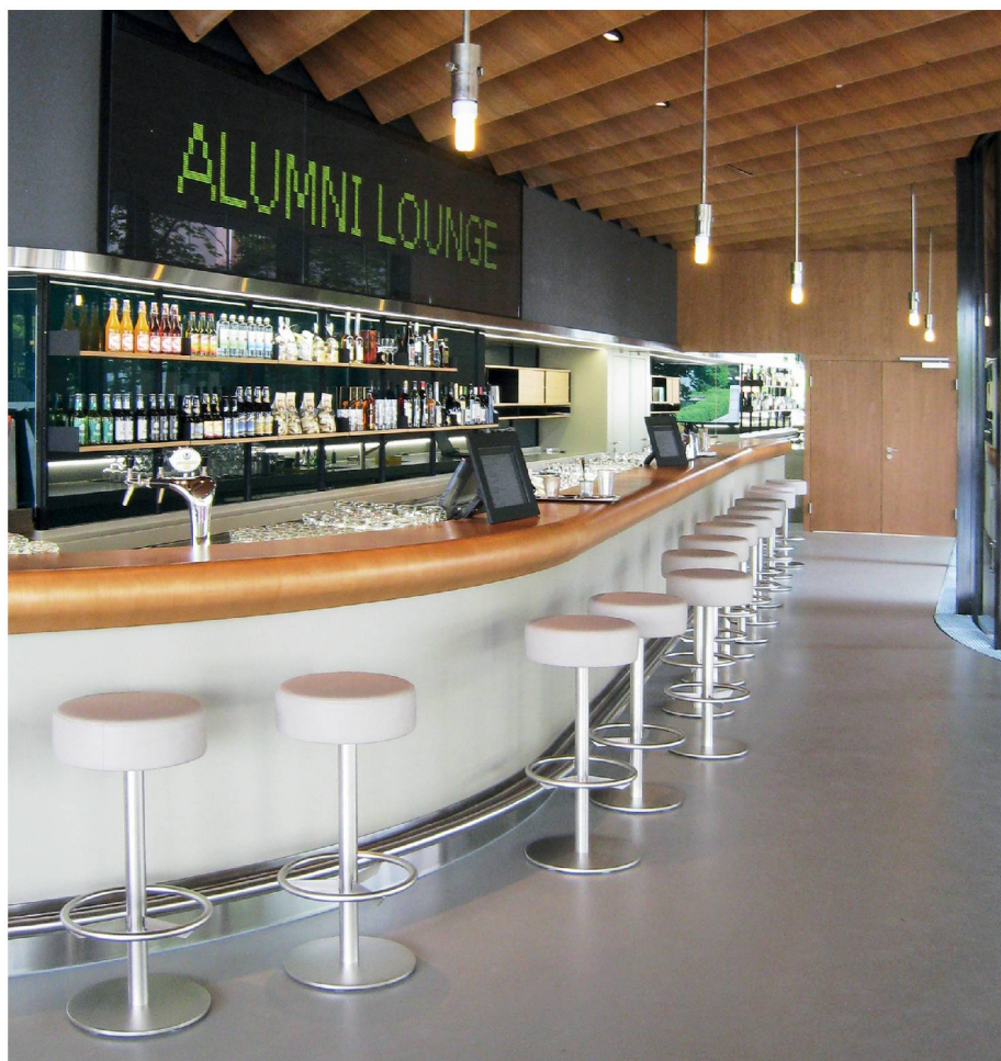
01 Die geschwungene Theke ist das Rückgrat der Lounge