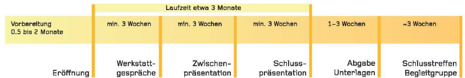
02 Typischer Aufbau einer Testplanung 03 Typischer Ablauf einer Testplanung (Grafiken: Autor)