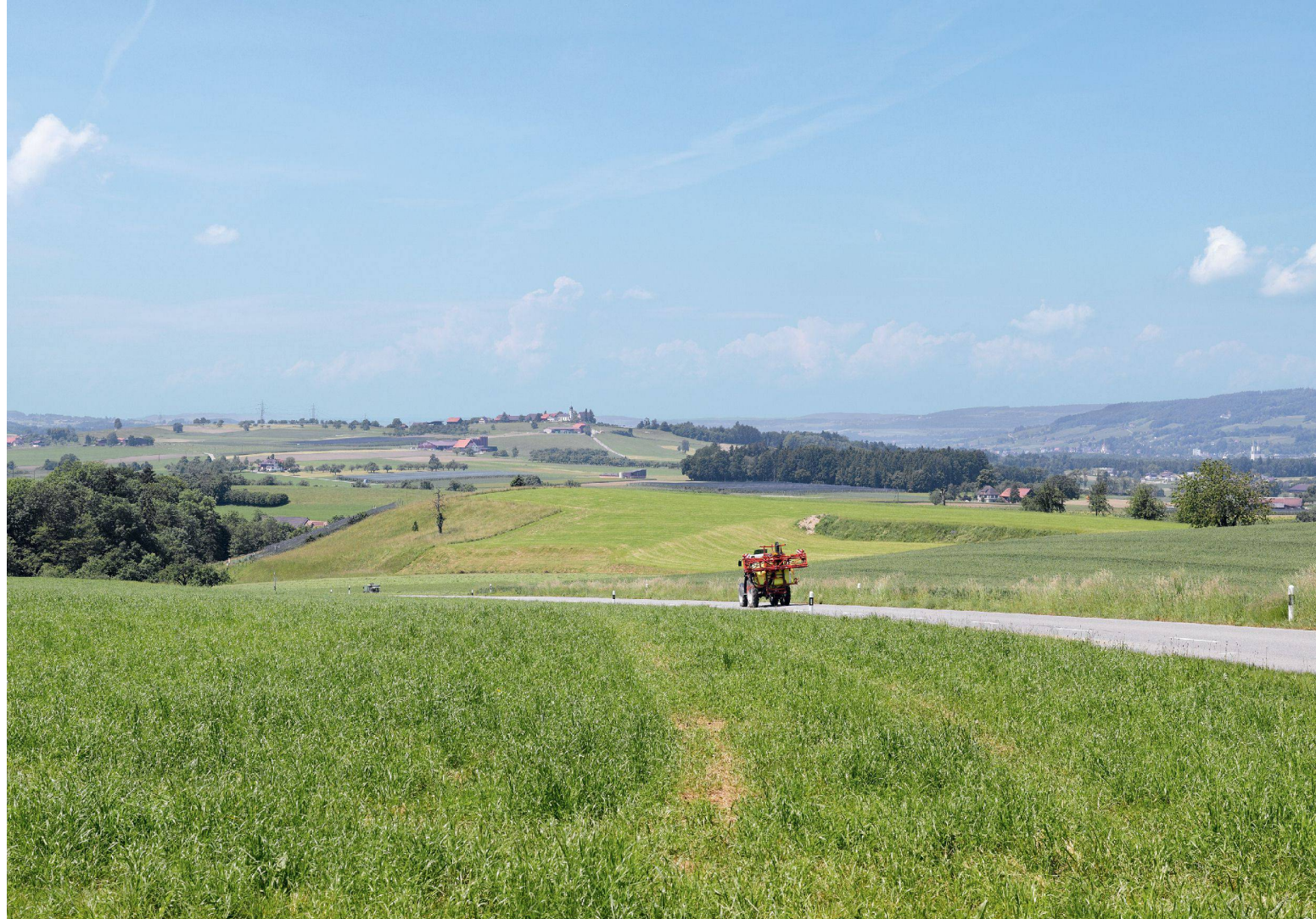
01 Zwischen Neukirch an der Thur und Buhwil TG

Wenn räumliche Probleme nicht mehr durch Erweiterung der Siedlungsfläche gelöst werden sollen, nehmen die Anforderungen an Koordination, Kooperation und Kommunikation zu, vor allem weil in den dichter besiedelten Gebieten mehr Akteure berücksichtigt werden müssen, deren Interessen oft divergieren. Die daraus folgenden Aufgaben sind deshalb anspruchsvoll und lassen sich in der Regel mit den formellen Verfahren wie etwa der Zonenplanung allein nicht lösen. Dafür ist nicht mangelndes Fachwissen verantwortlich, sondern das Fehlen von Möglichkeiten, sich mit den zuständigen Akteuren und Fachleuten über längere Zeit und in einem geordneten und überschaubaren Ablauf auf das Klären und Lösen einer schwierigen Aufgabe zu konzentrieren.