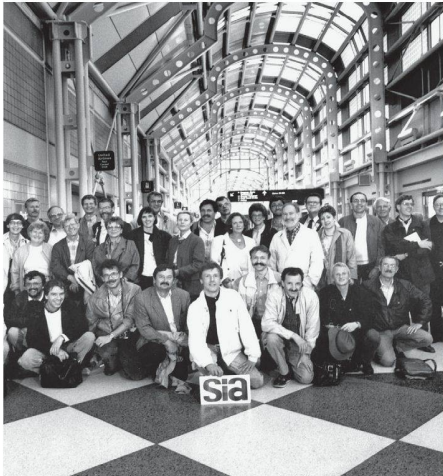
01 Aus dem Archiv: Reise nach Chicago 1989

(a&k) Vor 40 Jahren formulierte eine Gruppe um die Architekten Willy Althaus und Ulyss Strasser in Bern die Ziele einer Gruppe für «Architektur und Bauwesen» innerhalb des SIA. Die Fachgruppe für Architektur, die am 4. Juni 1970 von 250 Architekten im Kursaal in Bern gegründet wurde, sollte zu einer starken Brücke zwischen dem Verwaltungsapparat des Vereins und dem Berufsalltag der Architekten werden. Mit der Neuaufrichtung des SIA im Jahr 2000 wurde die Fachgruppe für Architektur in «SIA Fachverein für Architektur und Kultur» umbenannt und die Zielsetzung entsprechend angepasst.