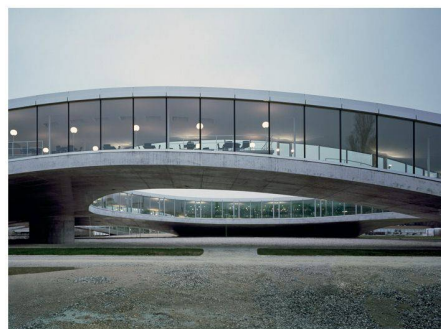
01 Einer der Schwerpunkte am Betontag: Rolex Learning Center EPFL (SANAA © Hisao Suzuki)

(pd) Am 1. September 2010 findet der Betontag der Fédération Internationale du béton (fib) an der EPF Lausanne statt. Die fib ist die einzige weltumfassende Fachvereinigung, die sich mit sämtlichen Aspekten des Betonbaus befasst. Eines ihrer Hauptziele ist die Verbreitung der neusten Entwicklungen im Betonbau. Anhand von Schweizer Leuchtturmprojekten wie dem Rolex Learning Center der EPFL, dem Zürcher Prime Tower oder dem Besucherzentrum im Nationalpark Zernez werden neuste Materialienanwendungen und Konstruktionsmethoden vorgestellt. Anlässlich des Kongresses, der alle vier Jahre stattfindet, wird auch die neue Publikation zu herausragenden Leistungen im Schweizer