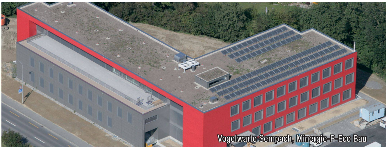
Vogelwarte Sempach, Minergie-P-Eco Bau