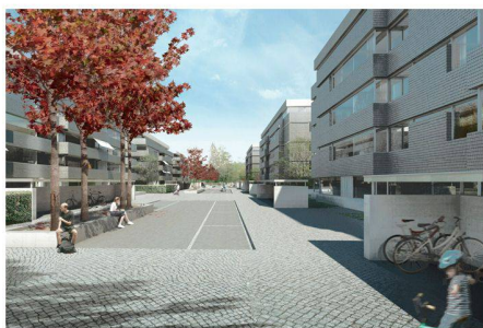
02 Flanierzone (Bild: Jakob Steib Architekten)