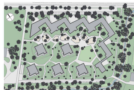
03 Engere Wahl (Plan: A.D.P. Walter Ramseier)

und die Wohnungen in der Enden der Mietwohnungszeile noch nicht den Lärmvorschriften genügen. Zugleich freut sich der Verkauf über zwölf Attikawohnungen.