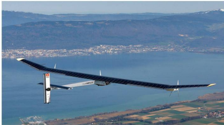
01 Kategorie Institutionen/Persönlichkeiten: «Solar Impulse»