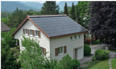
03 Kategorien Sanierung / PEB-Solarpreis: Rekord-PEB, FL-Vaduz