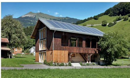
05 Kategorie Norman-Foster-Solar-Award: Sanierung Züst in Grösch

Die Projekte beim Schweizer Solarpreis 2010 erreichen einen durchschnittlichen Energieversorgungsgrad von 136%. Wenn alle Gebäude als Plus-Energie-Bau (PEB) funktionieren, können 22 KKW abgeschaltet werden, rechnet «Monsieur Solarpreis» Gallus Cadonau vor.