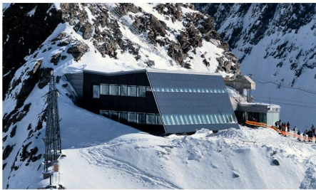
02 Kategorie Neubau: Solarrestaurant Klein Matterhorn